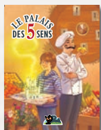
Les 5 sens et les aliments