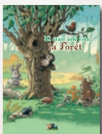
La forêt et les contes