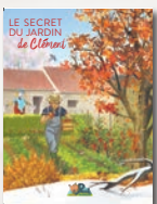
Le jardin et les saisons