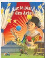
Les arts et les couleurs