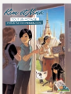
La diversité des langues